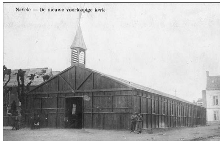
Na het opblazen van de kerk van Nevele op 19 oktober 1918 hadden de erediensten vanaf 9 april 1919 plaats in de houten noodkerk, de berlen kerk, op de Markt.