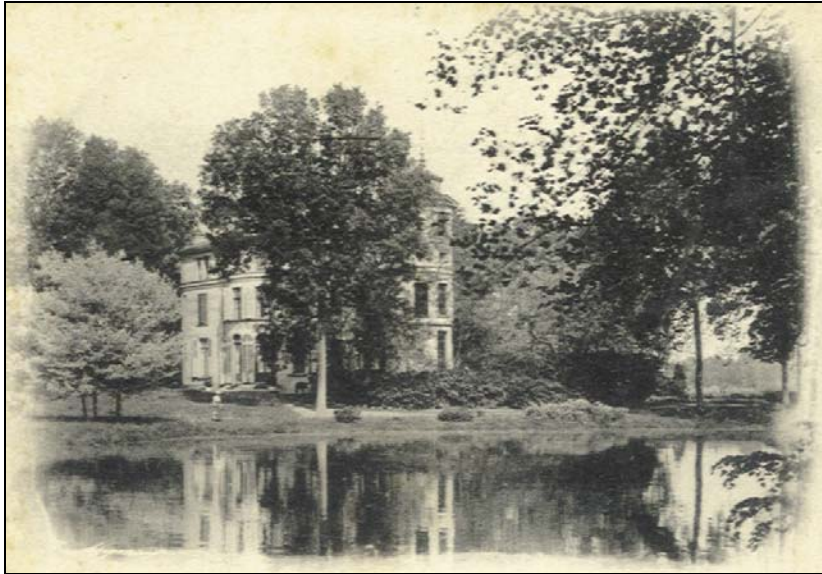
Het kasteel van de grondeigenaars van Hoobrouck ten Heule, in de volksmond beter gekend als het kasteel Mahy. (Verzameling A. Bollaert)