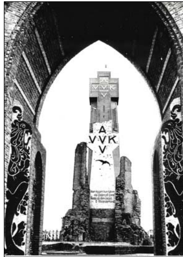
Diskmuide, de nieuwe IJzertoren gefotografeerd tussen de puinen van de oude toren.

Met echte harde censuur van de redactie heeft hij nooit te maken gehad maar 'Het Volk' was eerst en vooral een katholiek dagblad en er werd hem soms wel eens, eerder voorzichtig, erop gewezen om bepaalde zaken anders te schrijven of om aan bepaalde gevoelige zaken geen aandacht te besteden.