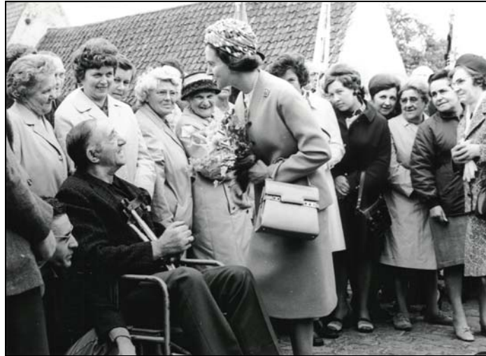
1972 Koningin Fabiola slaat een praatje met het publiek tijdens haar bezoek aan het MPI te Bachte.

Mooie momenten voor hem waren de koninklijke bezoeken in de streek zoals het reeds eerder vermelde bezoek van koning Boudewijn aan Vinkt in 1984 en het bezoek van koningin Fabiola aan het M.P.I. in Bachte in 1972.